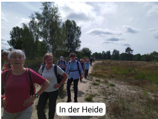
In der Heide

Wir kamen an zahlreichen Gewässern vorbei und bewunderten vom Aussichtsturm eine teilweise blühende Heidelandschaft. Wir sahen sehr viele Ameisen, einen Mäusebussard im Paradeflug und sogar ein Reh.