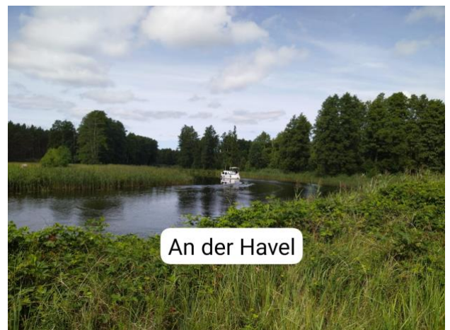
An der Havel

Wie immer gab es Informationen an den interessanten Stellen und zu den geologischen Besonderheiten an der Strecke.